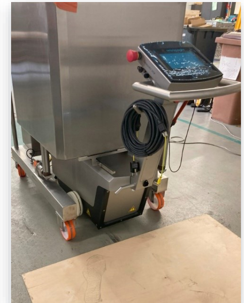
Holzplatte Dicke: ~4 mm