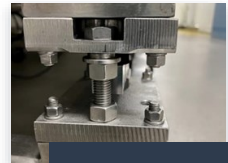
Beispiel einer DMS-Wägezelle mit montierter Transportsicherung