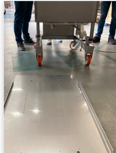
Aluminiumplatte Dicke: ~3 mm

Nach dem Aufprall beim Überrollen der 3 und 4 mm dicken Aluminium- und Holzplatten zeigten die Wägezellen eine Gewichtsänderung von weniger als 50 Gramm an. Diese Ergebnisse entsprachen den Anforderungen des Biopharma-Herstellers.